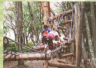
フィールドアスレチック