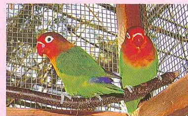
ルリコシボタンインコ