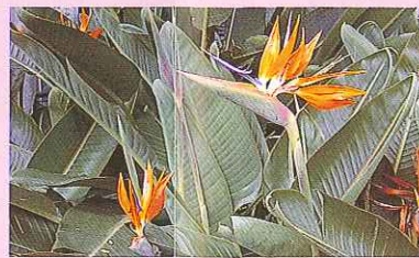
ゴクラクチョウカ