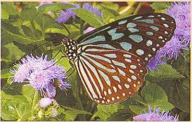
リュウキュウアサギマダラ