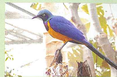
キンムネチョウピテリムク