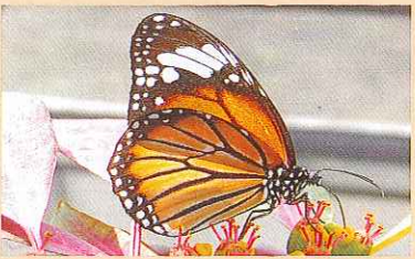
スジグロカバマダラ