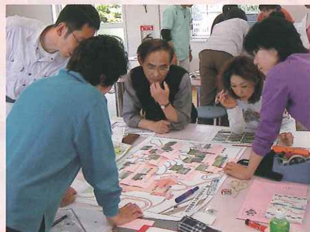
グループワークで計画