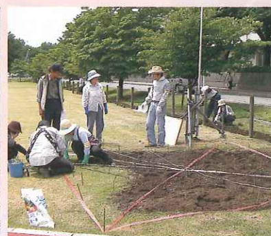
花壇づくりの実践

主催：栃木県、(財)栃木県民公園福祉協会 後援：日光市、(財)都市緑化基金、下野新聞社、 栃木放送、エフエム栃木、とちぎテレビ