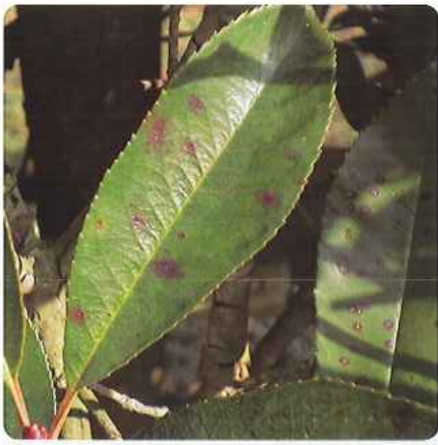
（斑点病にかかった病葉）

これはごま色斑点病とおもわれます。緑の相談所に寄せられる相談のなかでも多いもののひとつです。