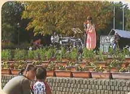
コスモス、マリーゴールドを植えたプランターで会場を修景 色々なステージも実施