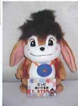
ぬいぐるみ（ピッピー） 1,575円