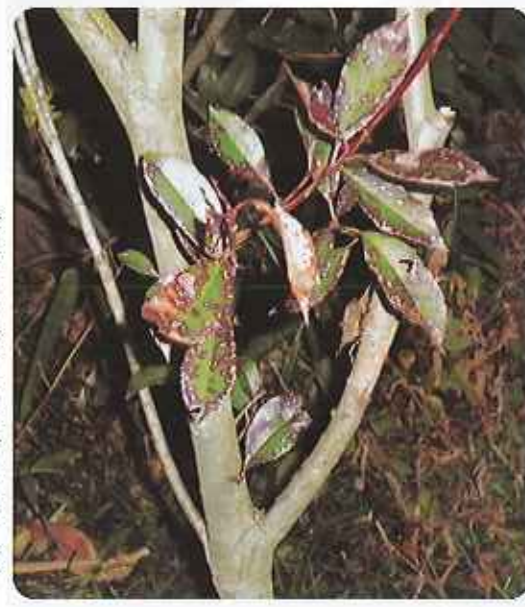
（枯れかかっているベニカナメ）

ベニカナメの生垣は剪定後に真っ赤な新葉が芽吹き、出そろった時には口を見張るような生垣になり多くの庭に使われています。ごま色斑点病は糸状菌というカビの仲間細菌に因り発生します。ベニカナメや西洋種であるレッドロビン、ピリなどにも発生します。一度発生すると毎年発生するので防除が難しい病気でもあります。