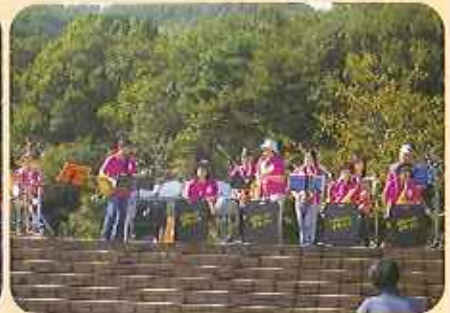
壮大なみかも山をバックに、数々の演奏を披露し、多くの来園者が楽しんだ。