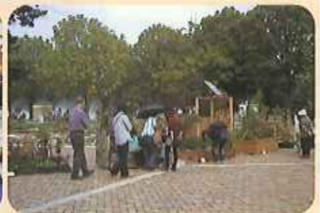
素晴らしい作品が揃った 県民花飾りガーデニング コンテストの部