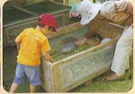
かわいい動物たちと実際にふれあうことができた「ふれあい動物園」子供にも大人にも大人気