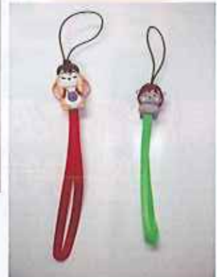
ストラップ （ピッピー、ピコ） ピッピー：400円、ピコ350円