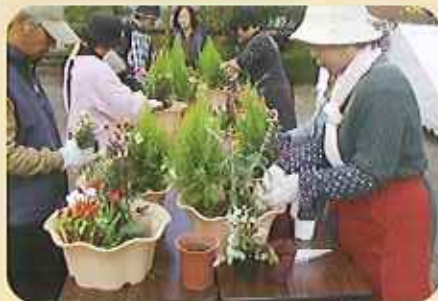
植え込み風景 できあがりイメージしながら 思い思いの作品を作った。