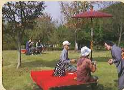
毎年人気の「秋のお茶会」今年も多くの方に万葉庭園のお庭とお茶を楽しんでいただいた。