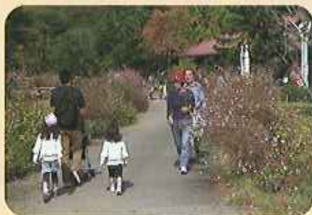
花のシルクロード 南門から夢花壇へと続く フラワーロード