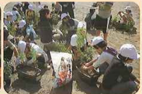
小学生の部 壬生小学校、羽生田小学校、 藤井小学校の児童が参加