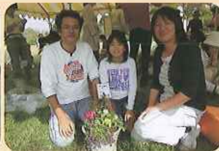
作品を前に大関さん一家 「自分たちで寄せ植えを作って 楽しかった」とのこと。