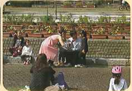
子供たちに大人気のアニメソングを子供たちと一緒に歌った「森のコンサート」