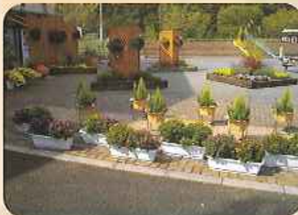
色とりどりの花を揃えたハンギングバスケットやプランターを数多く設置し、会場を華やかに演出。