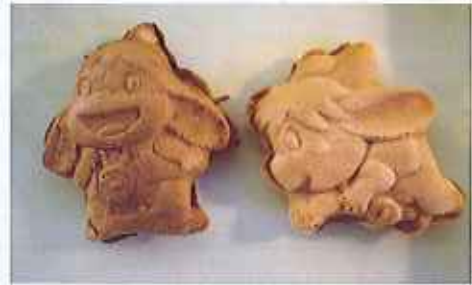
子供たちに大人気のピッピーのおやつ 味は「こしあん・クリーム」の2種類 1個 100円

甘くておいしいピッピーの形をしたお焼き「ピッピーのおやつ」も大人気！生地と餡には、栃木県内で生産された食材を使用しています。