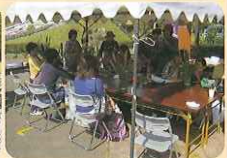
竹の器を使って、簡単ないけばなを体験できる「ミニいけばな教室」。お手軽感が好評。