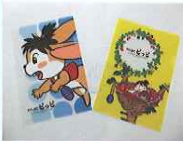
クリアファイル（青・黄色） 各 105円