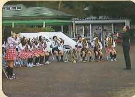
那須塩原市立南小学校音楽部のプラスバンド演奏。みんな頑張りました。