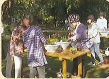
多くの参加者が、おもしろい作品を作る「ミニバラとハーブの寄せ植え」講座