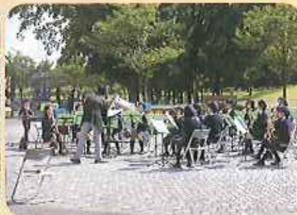
大人顔負けの素晴らしい演奏を披露してくれた、地元今市小学校吹奏楽部の演奏。