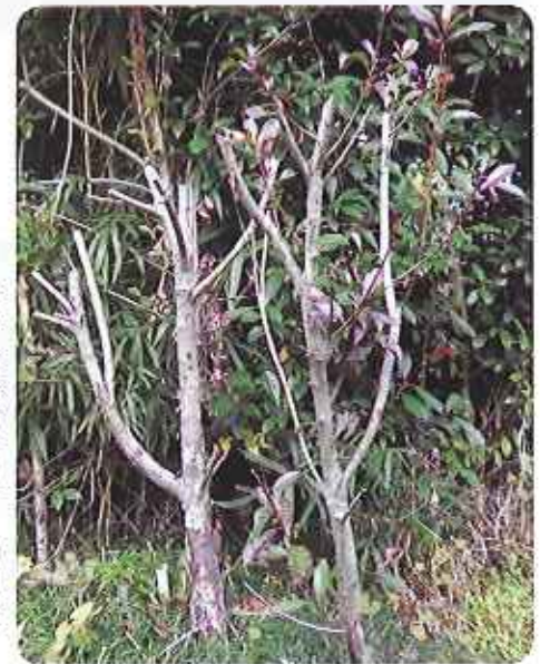
（枯れたベニカナメの樹幹）

毎年、5月～7月、9月～10月の雨の多い時期に多発します。葉に小さな斑点が多数発生し、時間がたつとやがて葉全体が赤褐色になっていきます。進行すると葉が落ちて枯れていきます。