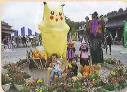
色とりどりの花とハロウィンをイメージしたカカシやカボチャが訪れる方をお出迎え。