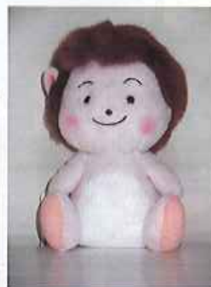
ぬいぐるみ（ピコ） 735円