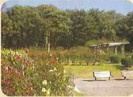
毎年グリーンフェスタの開催にあわせて見ごろを迎える秋バラ