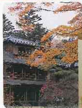
日仏造形美術フェスティバル展