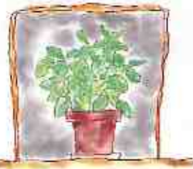
夕方からダンボールなどで覆う