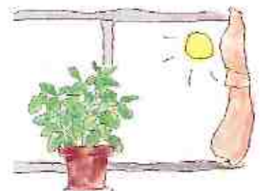
日中はよく日に当てる