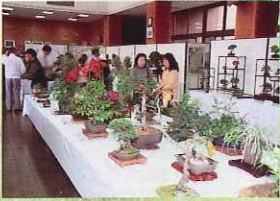
管理事務所・緑の相談所