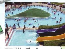
ファミリープール