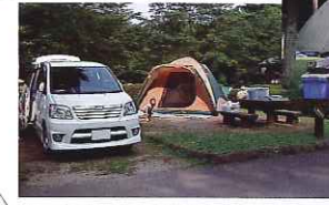
オートキャンプサイト