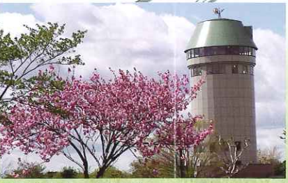
サンサントワー(展望塔)