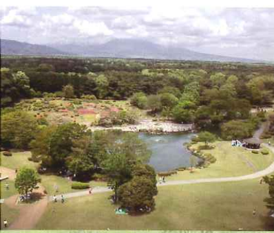
展望塔から那須野が原のパノラマ