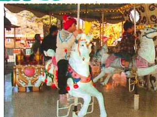
メリーゴーランド