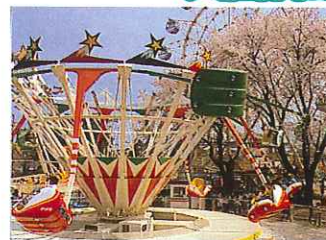
スーパースイング