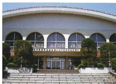
●トレーニングセンター

お問い合わせ・お申し込みは 〒321-0152 宇都宮市西川田4-1-1 (財) 栃木県民公園福祉協会 TEL028-659-1332 (遊園地直通) URL http://www.park-tochigi.com/tochinoki/