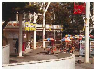
とちのきファミリーランド内売店