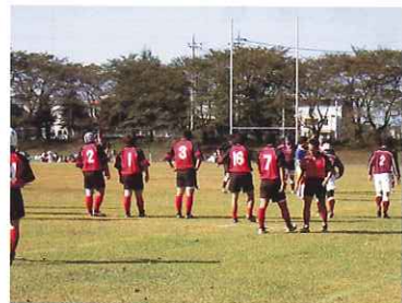
●サッカー・ラグビー場