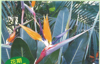
ゴクラクチョウカ