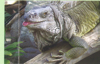
グリーンイグアナ