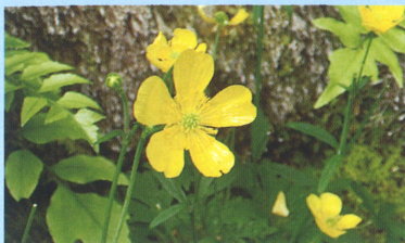
ミヤマキンボウゲ