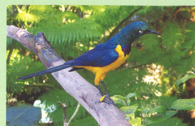
キンムネチヨウビテリムク