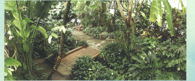
トロピカルバードゾーン

トロピカルバード・サバンナ・チョウの3つのゾーンで、熱帯・亜熱帯の色鮮やかな鳥や蝶たちが、館内を自由に飛び交う美しい姿を観察できます。