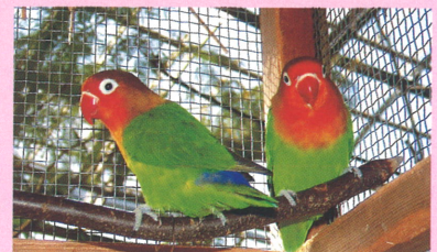
ルリコシボタンインコ