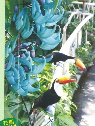
ヒスイカスラとオニオオハシ