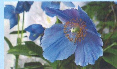
ヒマラヤの青いケシ