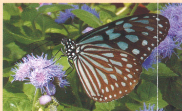
リュウキュウアサギマダラ