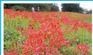
ヒガンバナ (9月中旬~下旬)