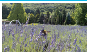
ラベンダー (6月中旬~7月上旬)