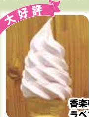
香楽亭オリジナル ラベンダーソフト 330円

みかも山公園管理事務所 (栃木市岩舟町下津原 1747-1) TEL: 0282-55-7272