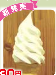
香楽亭オリジナル レモンガラスソフト 330円