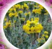
エルサレムセージ