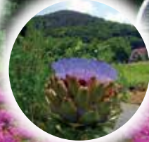
アーティチョーク