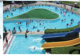
ファミリープール