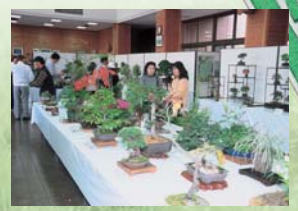
管理事務所・緑の相談所