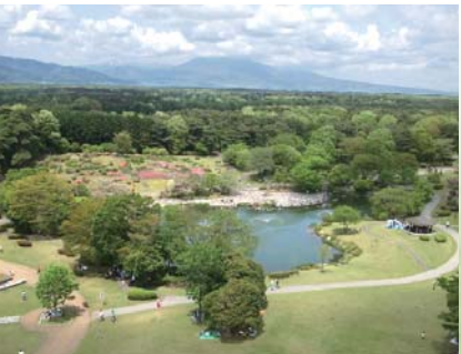
展望塔から那須野が原のパノラマ