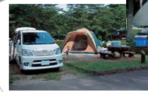
オートキャンプサイト