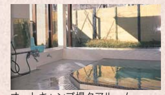
オートキャンプ場クアールーム

自動車でもキャンプができるオートキャンプサイト、テントで本格的なキャンプが楽しめるフリーテントサイト、充実した設備で快適なログハウス造りのキャビンがあります。場内には天然温泉のクアールームもあり大好評です。※要予約