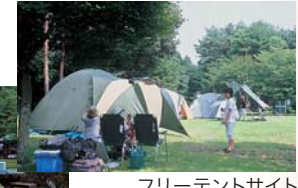
フリーテントサイト