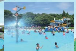
ファミリープール