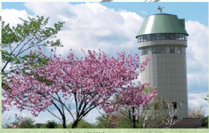
サンサンタワー(展望塔)