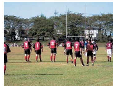
● サッカー・ラグビー場