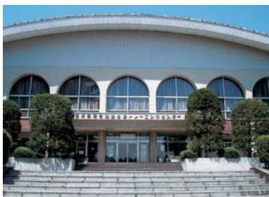
● トレーニングセンター