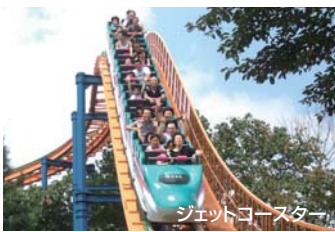
ジェットコースター