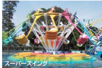
スーパースィング