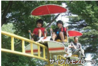
サイクルモノレール