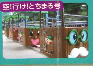
空!行け!とちまる号