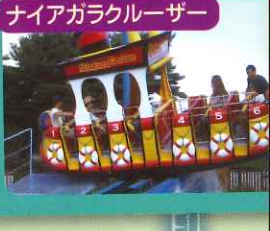
ナイアガラクルーザー