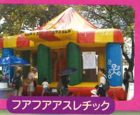
フアフアアスレチック