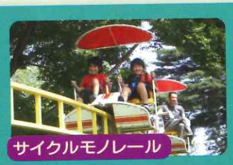
サイクルモノレール