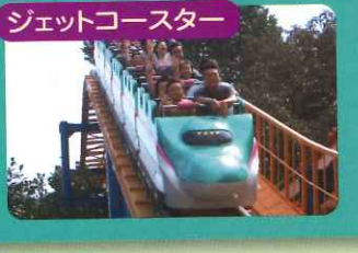
ジェットコースター