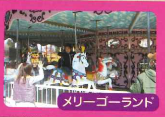
メリーゴーランド