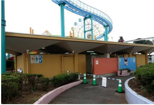
壁塗り後のイメージ